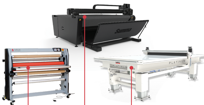
Laminação TrafficJet Summa F1612 CWT Work Table