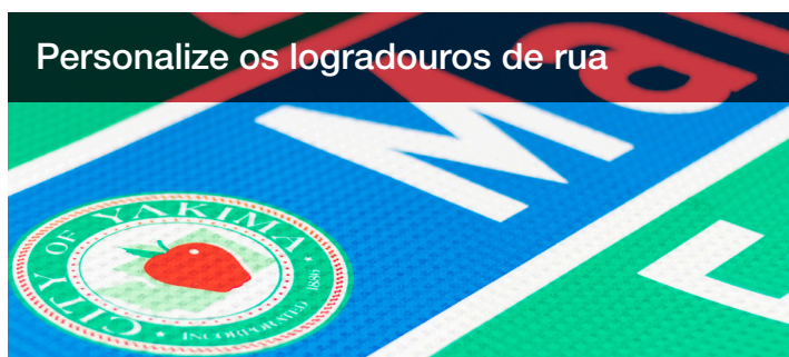
Personalize os logradouros de rua